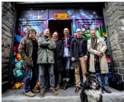
Weeping Willows uppträder på Södra teatern i sommar.